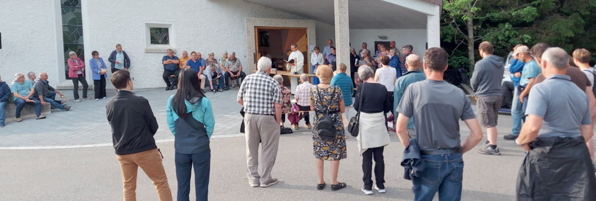
Zahlreiche Gläubige versammelten sich zur gemeinsamen Maiandacht vor der St.-Joder-Kapelle.