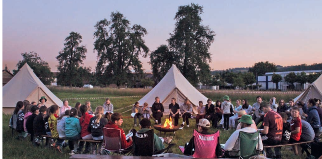
Lagerstimmung bei Sonnenuntergang.