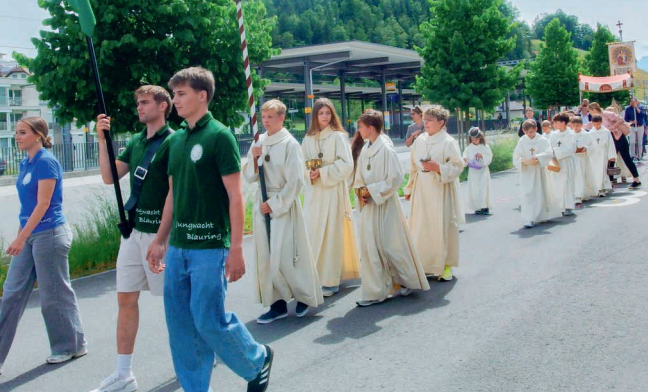
Prozession zur Pfarrkirche.