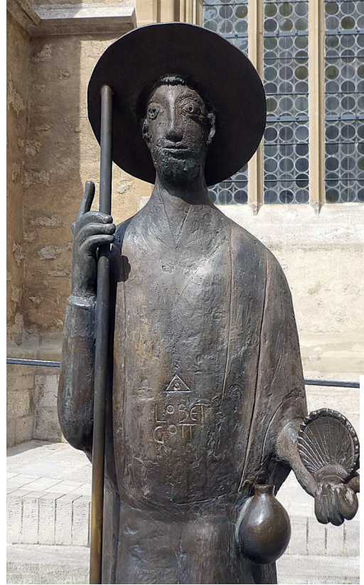
Jakobus mit Pilgerstab und Jakobsmuschel.