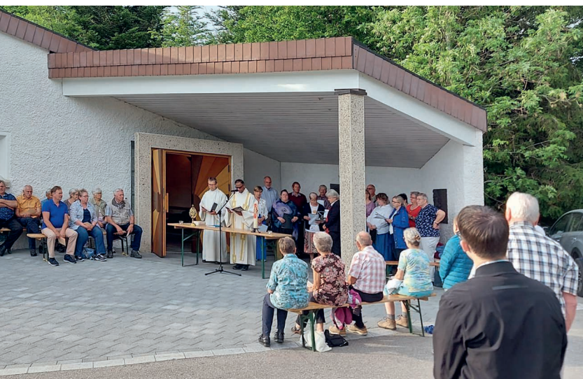
Die Maiandacht schenkte Momente der Besinnung, Begegnung und Verbundenheit.