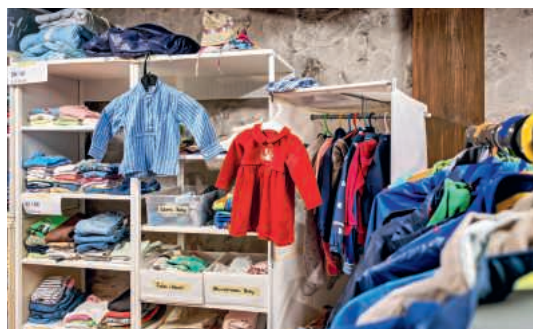
Der «Offene Kleiderschrank» befindet sich in einem Raum des Murihofs im Surseer Kirchenbezirk.

Kleider und Schuhe, Taschen, allerlei Accessoires, Schulrucksäcke oder Bettwäsche: Die Auswahl ist breit. Im grossen Raum im Murihof im Surseer Kirchenbezirk gehen Menschen ein und aus, die ihr Geld gut einteilen müssen: Armutsbetroffene aus Sursee und Umgebung. Im «Offenen Kleiderschrank» können sie sich kostenlos bedienen. Diese Möglichkeit nutzten letztes Jahr um die 100 Familien, 400 bis 500 Personen insgesamt. Letztes Jahr war der Kleiderschrank an 54 Halbtagen offen. Freiwillige – zurzeit elf – prüfen und sortieren, was Monat für Monat angeliefert wird: 40 bis 50 Säcke.