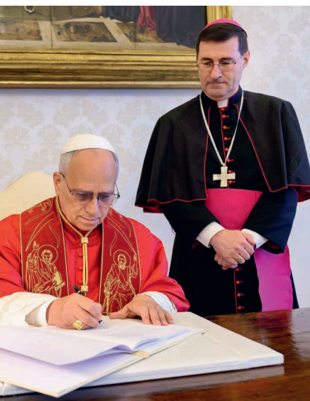
Papst Leo XIV. unterzeichnet die Enzyklika «Magnifica humanitas» – über die Bewahrung des Menschen im Zeitalter der künstlichen Intelligenz».

Für Leo ist Wahrheit ein Gemeingut des demokratischen Lebens. Das heisst: Wer die Wahrheit untergräbt – mit Fake News, Deep Fakes oder polarisierenden Narrativen –, der untergräbt auch die Demokratie. Ausserdem kann es Wahrheit für Leo nur geben, wo Verantwortung und Vertrauen bestehen. Das heisst, Wahrheit muss verhandelt werden. Sie ist kein fertiges Gebäude aus dogmatischen Grundsätzen, die wir einfach umsetzen oder verkündigen sollen. Es ist bemerkenswert, dass ein Papst das so schreibt.