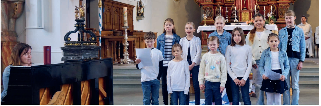
Der Kinderchor Menznau/Hergiswil bot eine festliche Liederwahl.