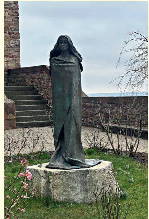
Hildegard-Statue vor der Abtei.

Nähere Informationen finden sich unter: www.prrw.ch/pastoralraumreise sowie auf den Flyern im Schriftenstand.