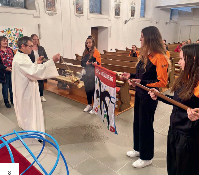
Eindrückliche Fahnenweihe in der Pfarrkirche.