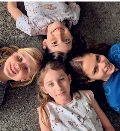
Vorfreude auf das Fest.