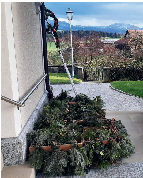
Palmbüschel bereit zum Segnen.

Als Jesus auf einem Esel in die Stadt Jerusalem eintritt, jubelten ihm die Menschen mit Zweigen zu. Sie hofften, dass Jesus sie von der Besatzung der Römer befreie. Diese Hoffnung wurde enttäuscht. Aber eine grössere Hoffnung zeigt sich: Jesus befreit die Menschen durch sein Leiden, Sterben und Aufstehen von allen Todesmächten. Deshalb sind die Palmbäume und -zweige Zeichen des Lebens und des Sieges. Wir bringen sie in unsere Häuser, um uns auch im Alltag daran zu erinnern, wie Gott uns ins Leben führt.