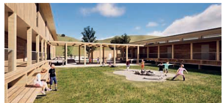
Visualisierung des Basecamps.