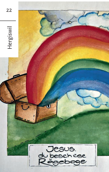
Das Kerzensujet.