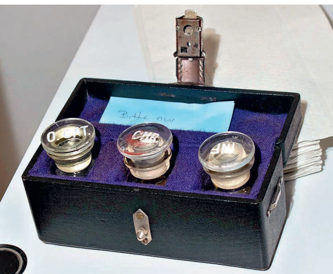
Edle Lederköffcherchen für den sicheren Transport.

Eine grosse 5-dl-Flasche mit rot-weissem Bügelverschluss bringt Priska Rüeeggsegger aus Rothenburg mit. Sie füllt sie zur Hälfte mit Chrisamöl. «Wir haben etwa 25 Täuflinge und 45 Firmlinge pro Jahr», erzählt sie. Für das Krankenöl hat sie ein kleineres Fläschchen dabei. «Am Krankensonntag kommen nicht mehr so viele Leute, um die Krankensalbung zu empfangen.» Nur vereinzelt werde ein Priester zu Menschen gerufen, um dieses Sakrament zu spenden.