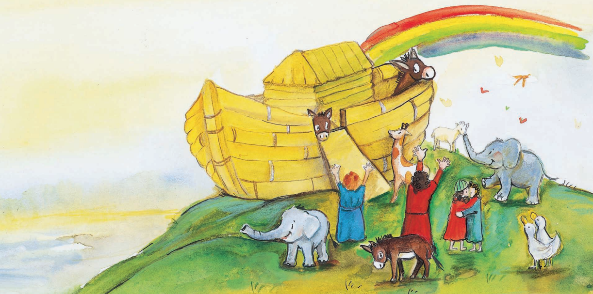
Noah und die Arche laden zum Mitmachen und Entdecken ein.