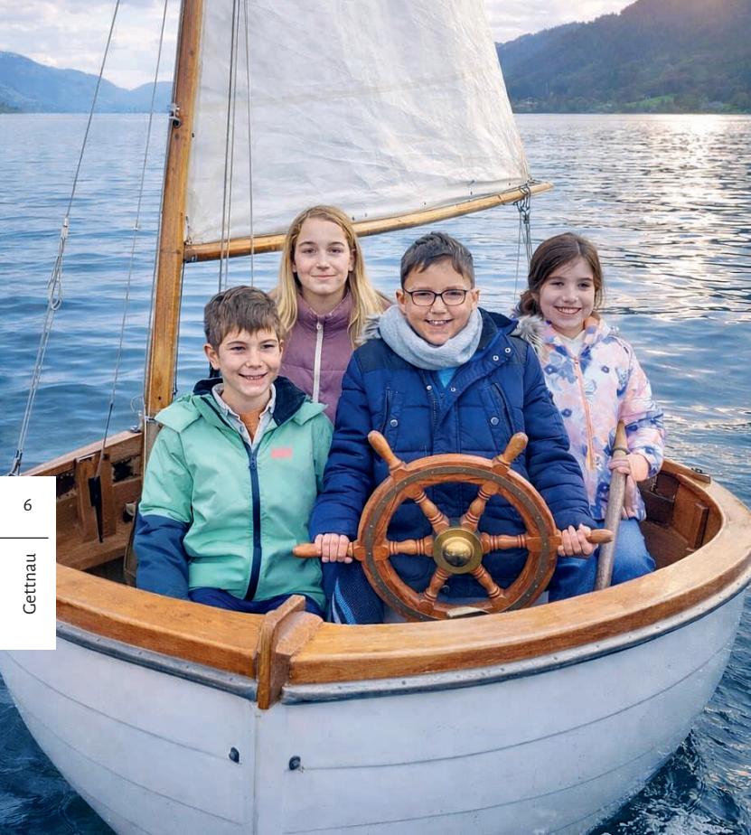
Die Erstkommunionkinder auf ihrer Reise.