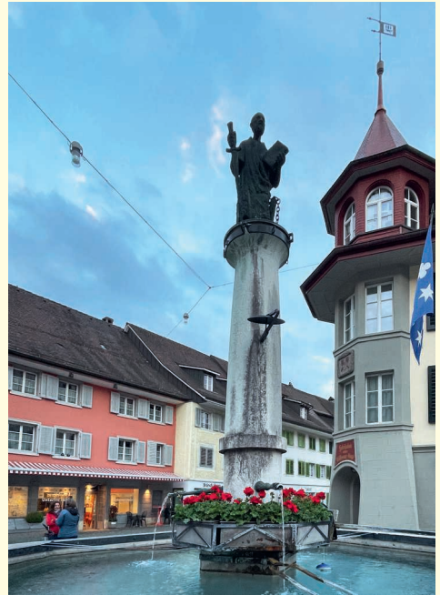
Der Paulusbrunnen ist Treffpunkt am 29. Juni.