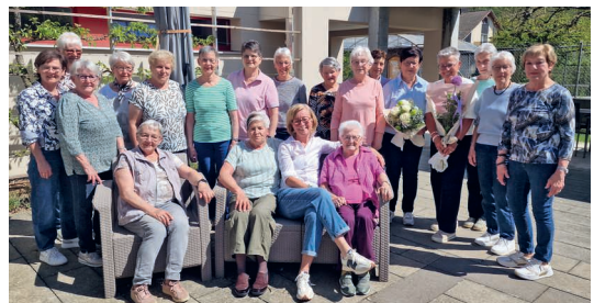
Sie sorgen dafür, dass Herzensbegegnungen entstehen.