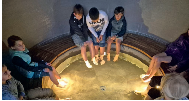
Erfrischender Ausflug nach Luthern Bad.