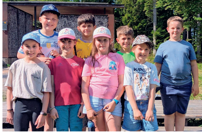
Die neu aufgenommenen Jubla-Kinder.