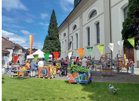
Lebendiger Treffpunkt für Gross und Klein.