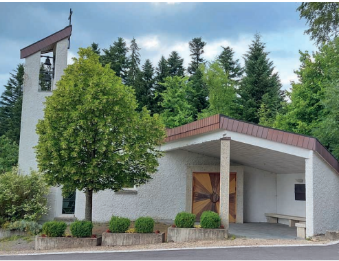
Die Kapelle St. Joder.