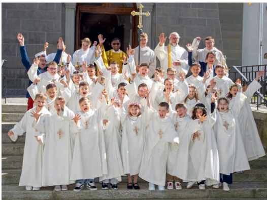
Die Gruppe vom Morgengottesdienst.