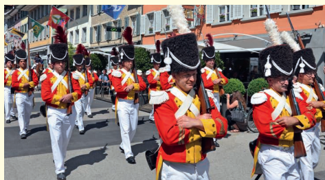
Die Herrgottsgrenadiere bei der Prozession zum Heilig-Blut-Fest.