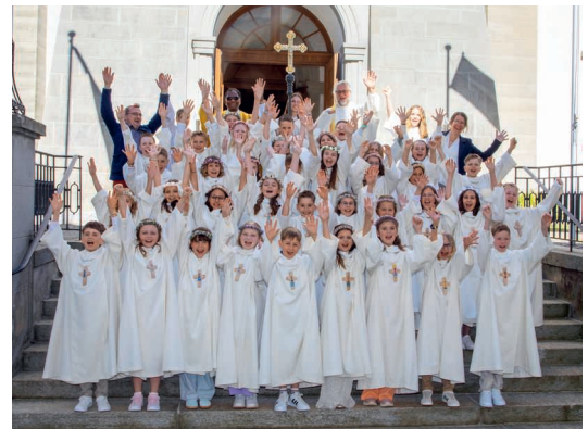
Die Gruppe vom Nachmittagsgottesdienst.