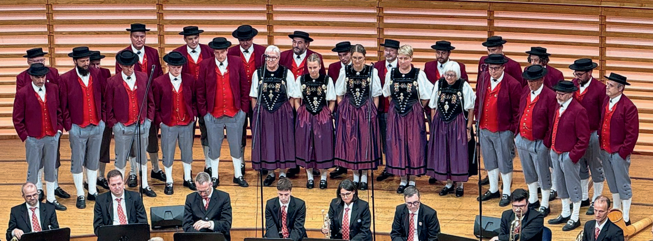
Das Jodlerchörli im Lehn aus Escholzmatt bei einem Auftritt im KKL.